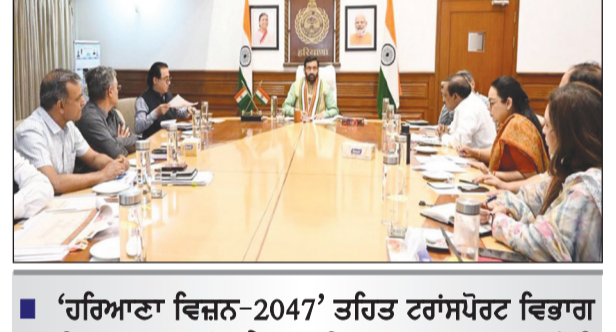
'ਹਰਿਆਣਾ ਵਿਜ਼ਨ-2047' ਤਹਿਤ ਟਰਾਂਸਪੋਰਟ ਵਿਭਾਗ ਦੇ 5 ਸਾਲਾ ਰੋਡਮੈਪ ਅਤੇ ਕਾਰਜ ਯੋਜਨਾ ਸਬੰਧੀ ਸਮੀਖਿਆ ਮੀਟਿੰਗ ਦੌਰਾਨ ਜਾਰੀ ਕੀਤੇ ਗਏ ਨਿਰਦੇਸ਼

ਦੇਸ਼ ਪ੍ਰਦੇਸ਼ ਚੰਡੀਗੜ੍ਹ, 26 ਮਈ (ਦੇਸ਼ ਪ੍ਰਦੇਸ਼ ਬਿਊਰੋ) :