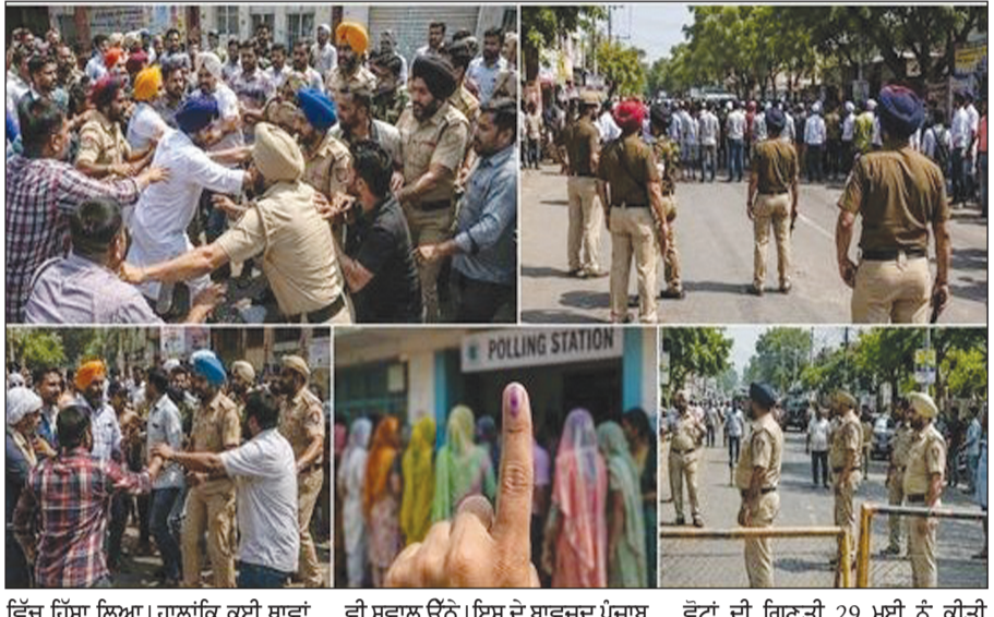
ਵਿੱਚ ਹਿੱਸਾ ਲਿਆ। ਹਾਲਾਂਕਿ ਕਈ ਥਾਂਵਾਂ 'ਤੇ ਝੜਪਾਂ ਵੀ ਹੋਈਆਂ ਅਤੇ ਕਈ ਇਲਾਕਿਆਂ 'ਚ ਜਾਅਲੀ ਵੋਟਾਂ ਨੂੰ ਲੈ ਕੇ ਵੀ ਸਵਾਲ ਉੱਠੇ। ਇਸ ਦੇ ਬਾਵਜੂਦ ਪੰਜਾਬ ਭਰ 'ਚ ਵੋਟਿੰਗ ਪ੍ਰਕਿਰਿਆ ਦਾ ਕੰਮ ਅਮਨ-ਸ਼ਾਂਤੀ ਨਾਲ ਨਿਬੜ ਗਿਆ। ਇਨ੍ਹਾਂ ਦੁਪਹਿਰ 2 ਵਜੇ ਤੱਕ 45.60 ਡਿਸੀ

ਦੇਸ਼ ਪ੍ਰਦੇਸ਼ ਚੰਡੀਗੜ੍ਹ, 26 ਮਈ (ਦੇਸ਼ ਪ੍ਰਦੇਸ਼ ਬਿਊਰੋ) :